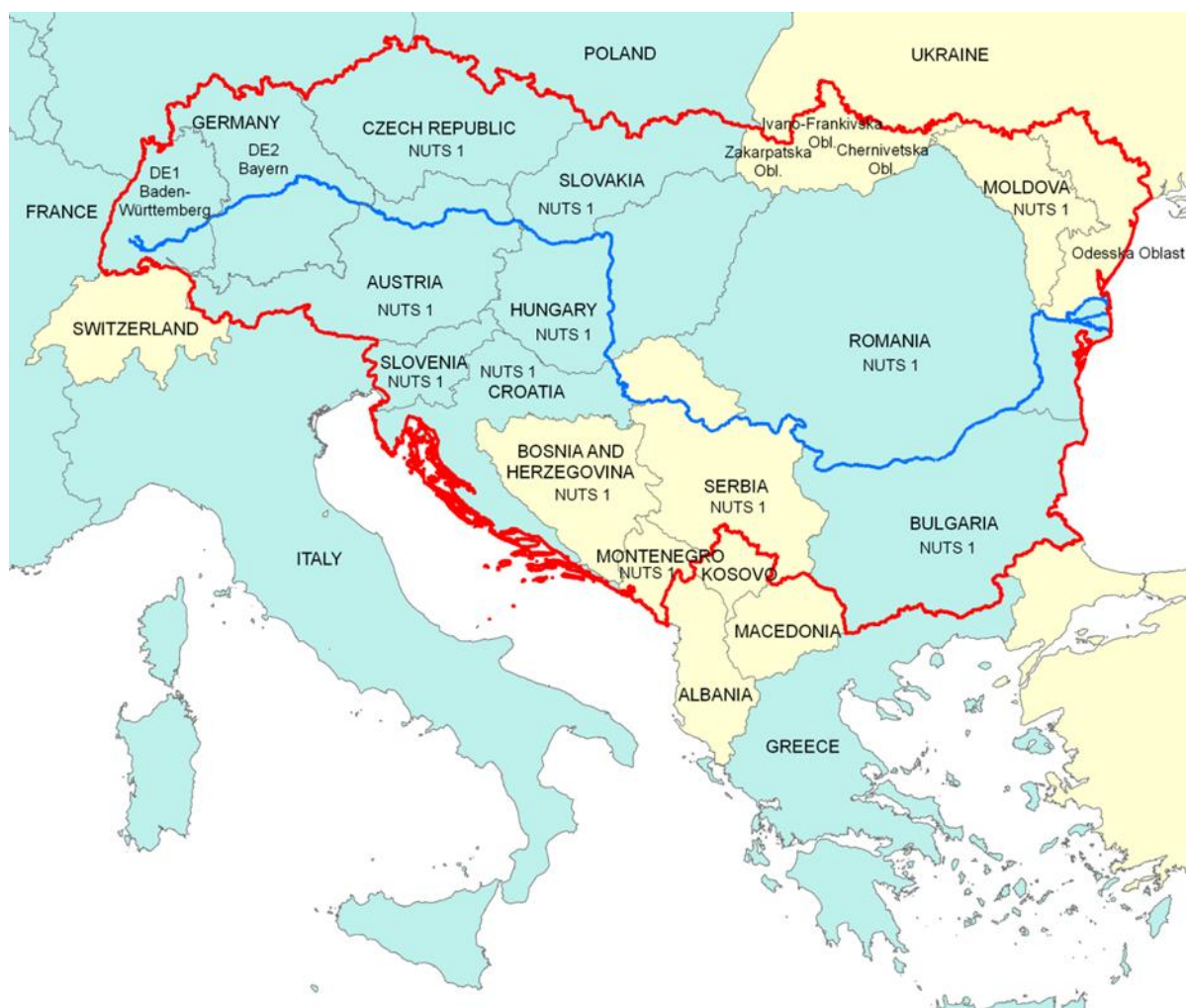
Obrázok 1: Programová oblasť

Geograficky sa oblasť DTP prekrýva s územím spadajúcim pod Stratégiu EÚ pre dunajský región (EUSDR), zahŕňajúcim aj povodie rieky Dunaj a horské oblasti (ako sú Karpaty, Balkán a časť Álp). Ide o najmedzinárodnejšie povodie rieky na svete. Oblasť pokrýva pätinu územia EÚ a je obývaná približne 114 miliónmi obyvateľov. Rozmanitosť prírodného prostredia, sociálnoekonomické rozdiely a kultúrna diverzita rôznych častí oblasti môžu byť vnímané ako veľké výzvy, v skutočnosti však predstavujú významné možnosti a nevyužitý potenciál.